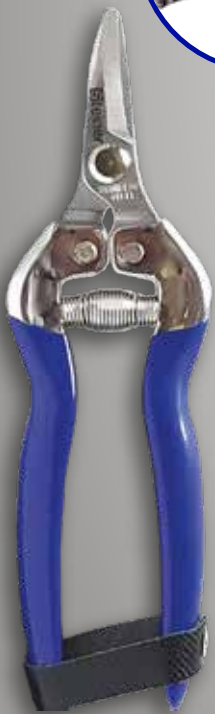
TIJERA PROFESIONAL 202 I