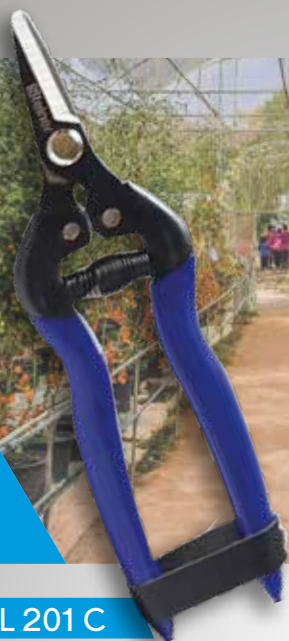
TIJERA PROFESIONAL 201 C