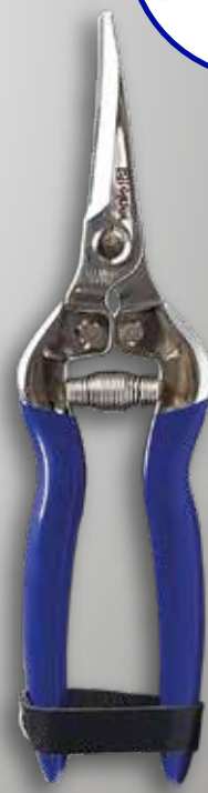
TIJERA PROFESIONAL 206 I