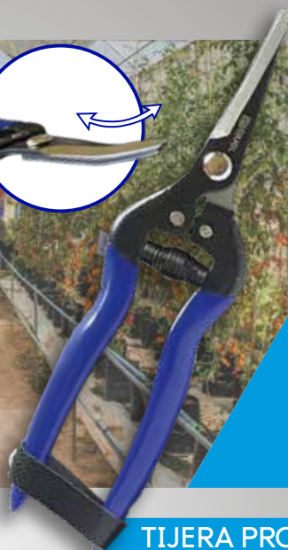
TIJERA PROFESIONAL 203 C