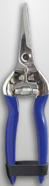
TIJERA PROFESIONAL 204 I